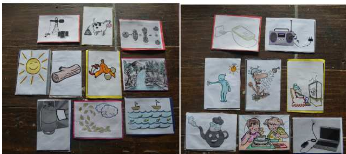
Figura 3: conjunto de tarjetas como material para usar en los talleres EduMAyE.

taller una vez que ya ha comenzado. Se estima que el número de asistentes por municipio varía entre los 5-6 de Los Naranjos a los más de 25 de Río Blanco.