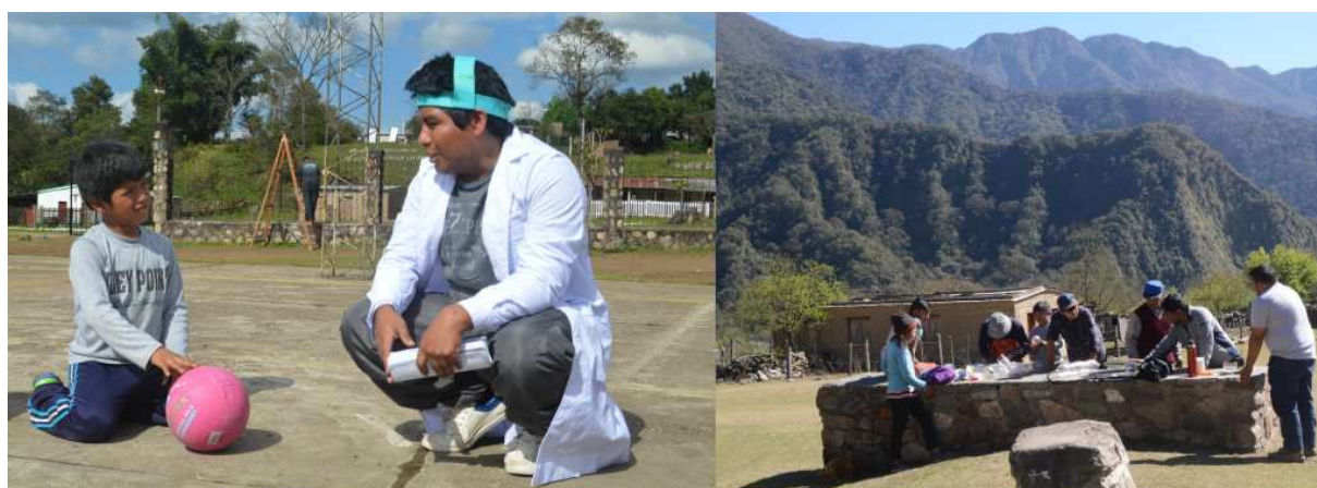
Figura 4: Los talleres El Dr. de la energía y Fuentes de energía y usos , en pleno desarrollo.