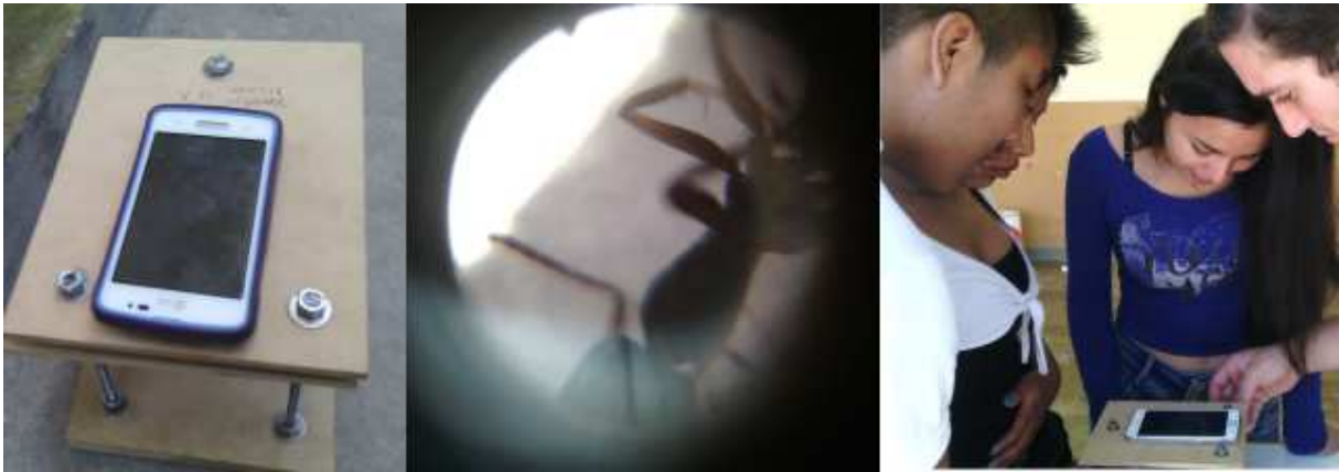
Figura 6: Microscopio de bajo costo construido en el taller de física y medición de su aumento.